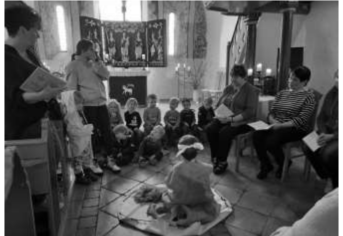
Der blinde Bettler Bartimäus (Mitte sitzend) bittet Jesus (linksstehend) um Hilfe, dass er wieder sehen kann.

Da die Kinder auf dem Weg zur Kirche schon viele Frühlingsblüher in den Gärten bewundern konnten, schickten sie die Frauen mit dem Lied „Immer wieder kommt ein neuer Frühling“ in den Frühling. Als Dank für die Vorführung gab es von den Frauen nicht nur viel Applaus, sondern auch Obst und Naschereien.