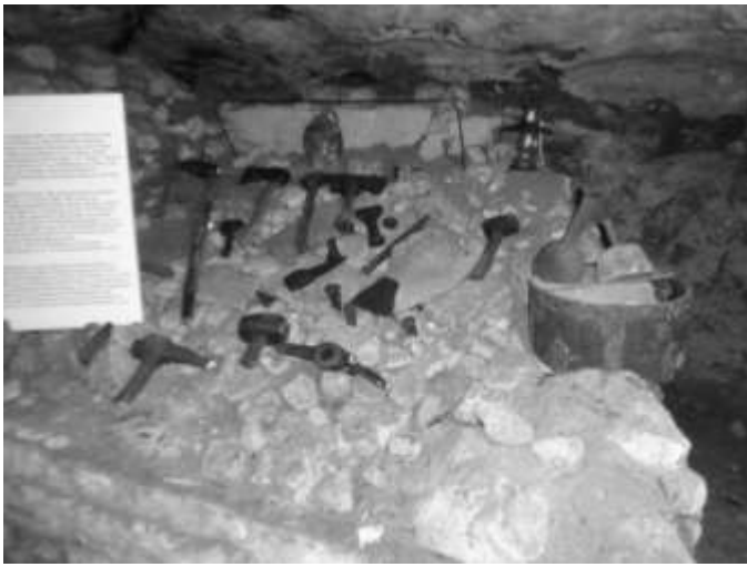
Werkzeug der Sandmacher

Nach der mittäglichen Stärkung in der Gaststätte Brückenmühle ging es zur Kirchenburg Walldorf/Werra. Wenn man den Berg hinaufsteigt und die Wehranlage mit Kirche zu sehen bekommt, glaubt in die mittelalterliche Geschichte einzutauchen. Die Anlage wird ja auch bereits 982 erstmal urkundlich. Auch die Kirche wirkt äußerlich sehr alt. Man findet am Kirchturm romanische Fenster. Das Kirchschiff hat gotische Fenster. Die ursprüngliche Innenausstattung war im Stil der Renaissance, der Orgelprospekt war aus dem Barock. Doch wenn man heute in die Kirche eintritt, entfährt einem ein „WOW“. Eine moderne Kirche mit bunten Glasfenstern, schönen Bänken, eine moderne Orgel und ein außergewöhnlicher Altartisch. Der Altartisch besteht aus einer großen Eisenplatte und den verkohlten Balken des Daches. Und das kam so, am 3. April 2012 brannte die Kirche fast völlig ab.