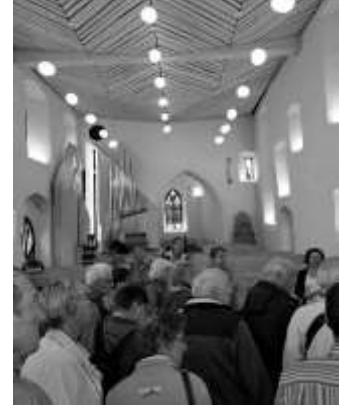
Helle moderne Kirche

Die Führung durch die am 11. Mai 2019 feierlich wiedereröffnete Kirche hinterließ bei den Teilnehmern der Exkursion wunderbare und interessante Eindrücke. Die Erlebniskirche für alle!