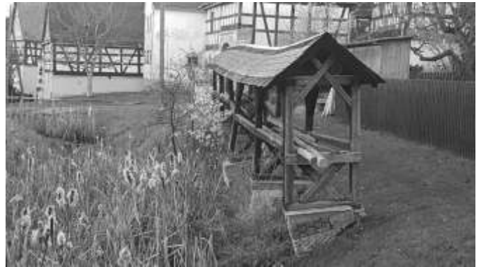
Leiterhaus vor der Sanierung