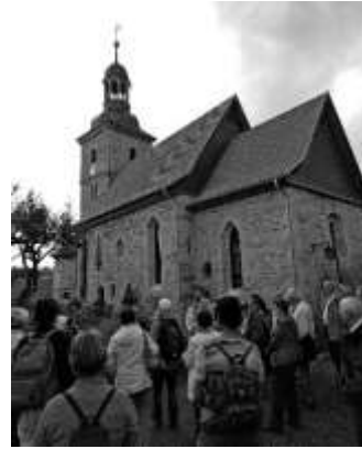
Kirche in Walldorf