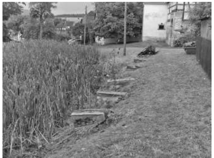
Rückbau für Rekonstruktionsarbeiten