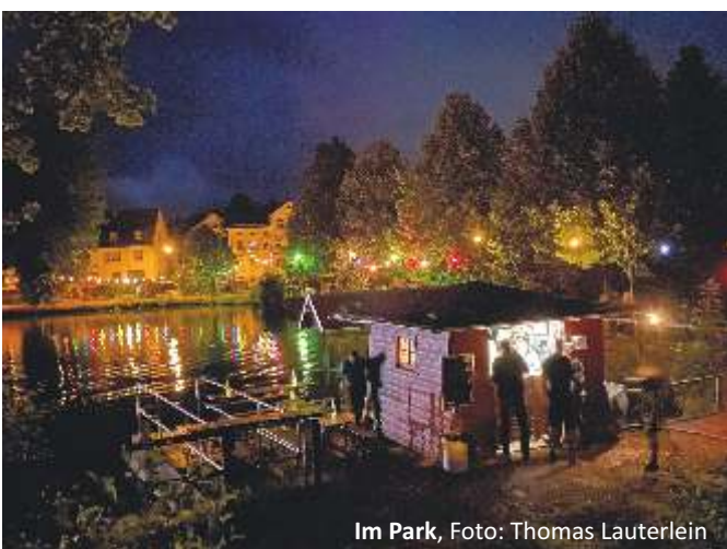
Im Park