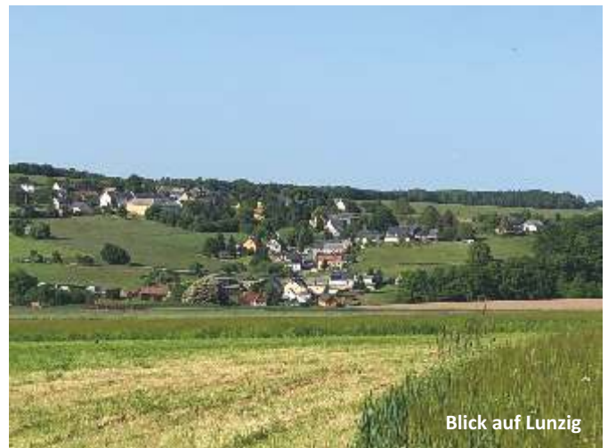
Blick auf Lunzig