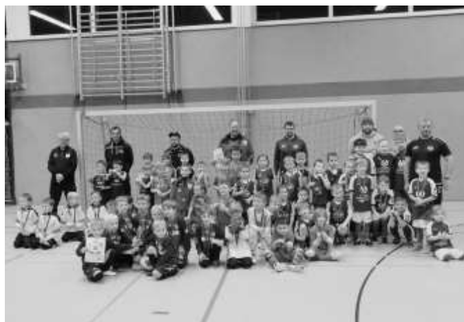
Alle Kinder und Trainer beim Turnier der G-Junioren

Von den Fans gab es ein starkes Interesse aus nah und fern. Bei allen Turnieren waren die Ränge in der Halle voll ausgelastet und sehr gut gefüllt. Somit war für eine lautstarke Unterstützung aller Spieler und Spielerinnen gesorgt. Bei den eingeladenen Teams kam die Veranstaltung sehr gut an und lobten die Ausrichter für ein „toll organisiertes Hallenturnier“.