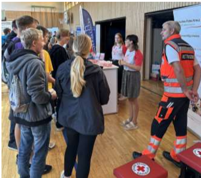
Schüler der 10. Klasse am DRK-Stand