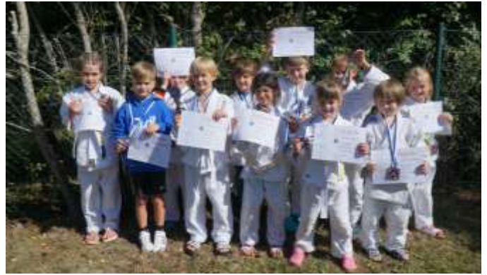
Die Aumaer Judokämpfer der u8 zeigen stolz ihre Medaillen.