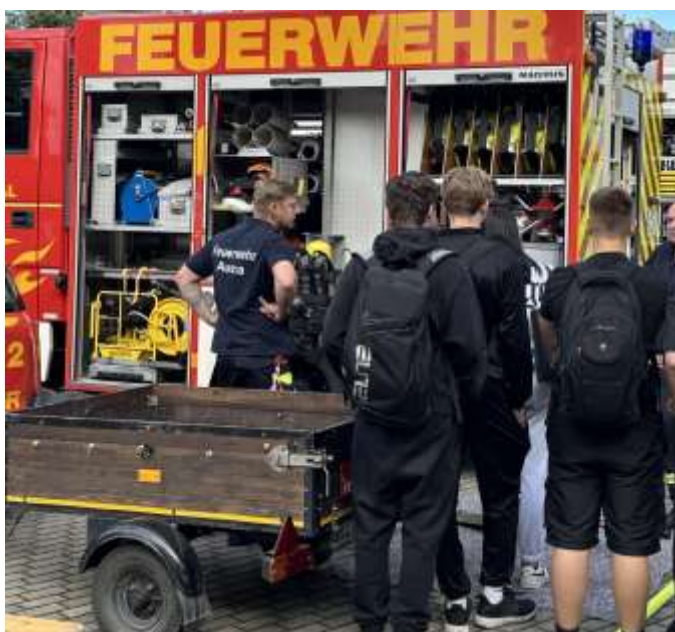
Schüler der 8. Klasse an der Blaulicht-Meile