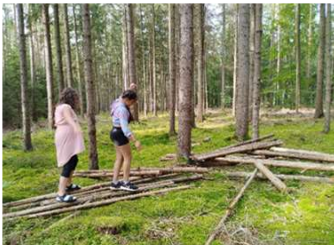
Text/Foto: Luisa Neuparth