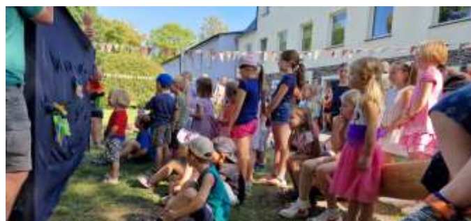
Text/Fotos: Manuela Müller