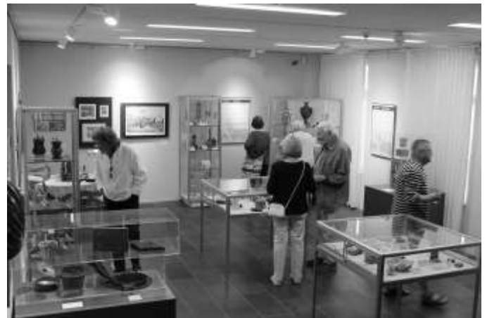
Gäste der Vernissage am 13. Juli 2023 im Städtischen Museum Zeulenroda

Die aktuelle Sonderausstellung im Städtischen Museum Zeulenroda widmet sich dieser zeitlosen Thematik in vier Bereichen. Mit „Völlerei“, „Rausch“, „Körperkult“ und „Sprichwörter“ wird die Kulturgeschichte von „Lust & Laster“ beleuchtet. Bei der Entwicklung der Ausstellung traten auch Kuriositäten zutage. So verpflichteten sich die Angehörigen des Temperenzordens um 1600, zu jeder Mahlzeit nicht mehr als sieben Becher Wein zu trinken. Zu sehen ist „Lust & Laster“ im Städtischen Museum Zeulenroda zu den üblichen Öffnungszeiten bis zum 22. Oktober 2023. TG