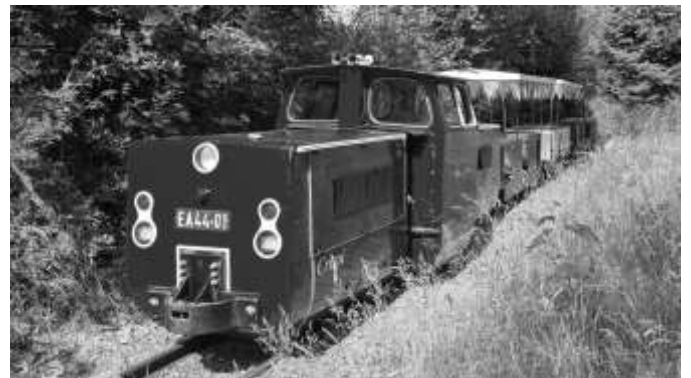
Bei bestem Sonnenschein wartet Lok Crispi mit ihrem Zug auf viele Gäste. Hauptbahnhof der Ferienlandeseisenbahn, 06/2023

Die Ferienlandeseisenbahn fährt entlang der Wisenta und kreuzt den Rundwanderweg Saale-Wisenta-Plothengrund. Für einen kleinen Spaziergang ist die Ferienlandeseisenbahn ein guter Ausgangspunkt. Vom Bergkamm schaut man zur Saale herunter und in Sichtweite befindet sich die Wisentatalsperrung.