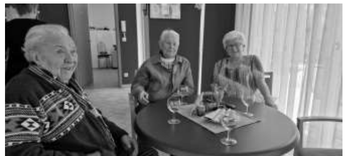
Text/Fotos: Manuela Müller