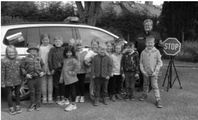
Text/Fotos: Daniela Zelle