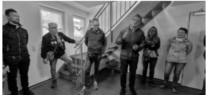
Text/Fotos: Manuela Müller