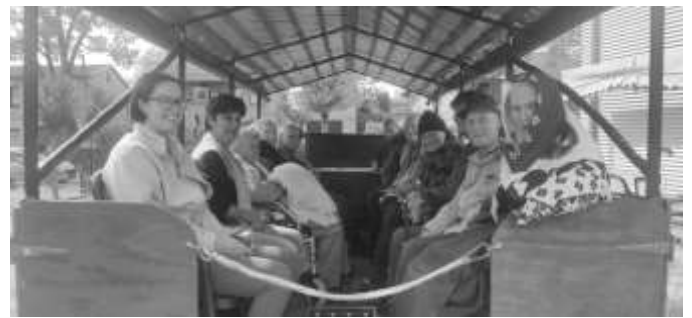
Text/Fotos: Patrick Urban