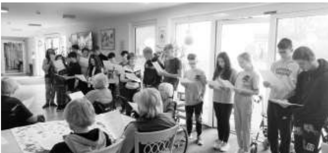
Text/Fotos: Patrick Urban