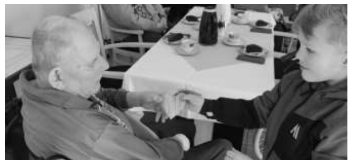
Beitrag und Fotos: Patrick Urban