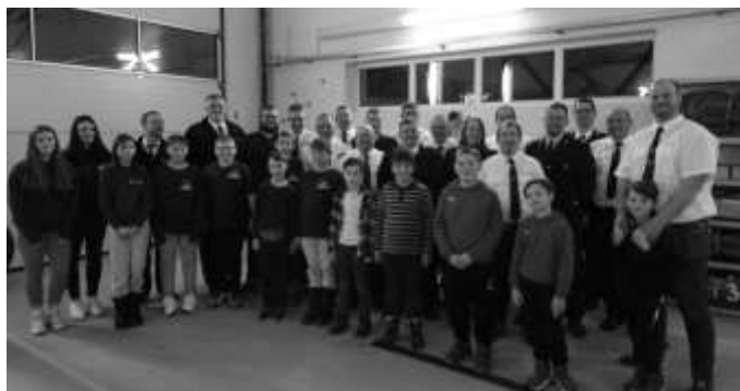
Gruppenfoto FW Auma-Weidatal zur Jahreshauptversammlung 21. Januar 2023.