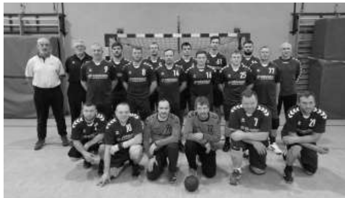
Akteure beider Männerteams in den Trikots der ERVEMA agrar Gesellschaft