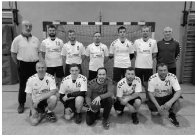
Die erste Männermannschaft in den HBS Elektrobau Trikots.

Ende des vergangenen Jahres konnten sich die beiden Männermannschaften in neuen Trikots präsentieren, die von den Firmen HBS Elektrobau Oettersdorf und der ERVEMA agrar Gesellschaft mbH Wöhlisdorf gesponsert wurden. Diesen Firmen gilt auch an dieser Stelle für die Unterstützung der Blau Weiß Handballer ein großer Dank vom Vorstand und Spielern.