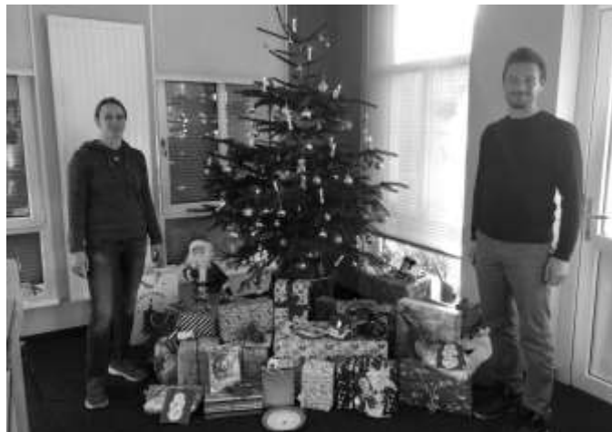
Bodyhouse Geschenke KJH