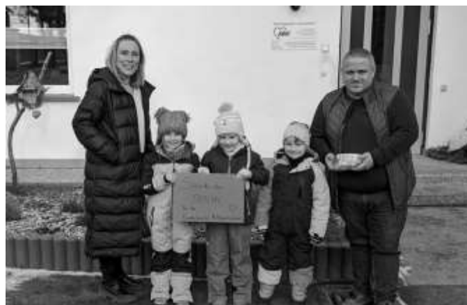
Text/Fotos: Manuela Müller

Am 15. Januar durften wir im Kindergarten „Sonnenschein“ in Auma-Weidatal unsere Spende in Höhe von stolzen 503,78 € an den Spendenengel Herrn Voigt vom Kinderhospiz Mitteldeutschland übergeben. Eingenommen haben wir das Geld im Rahmen unseres Weihnachtsmarktes in der Kita im letzten Dezember. Wir hoffen, dass wir damit Gutes tun konnten, um Menschen zu helfen, denen es nicht so gut geht wie uns.