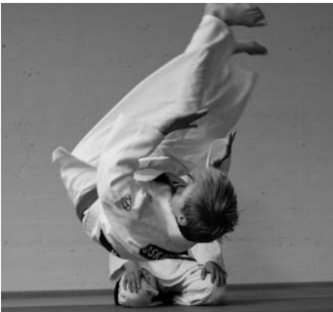
Auch das sichere Fallen gehört zu einer Prüfung.