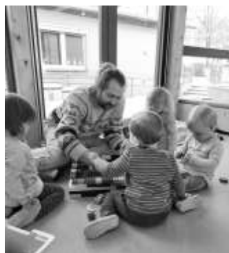
Text/Fotos: Andrea Schauerhammer