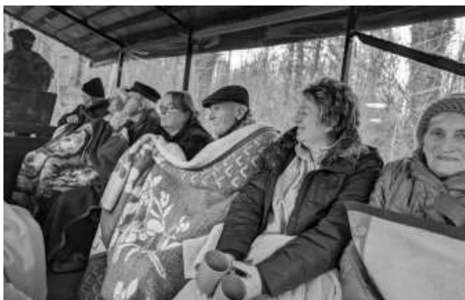
Text/Foto: Patrick Urban